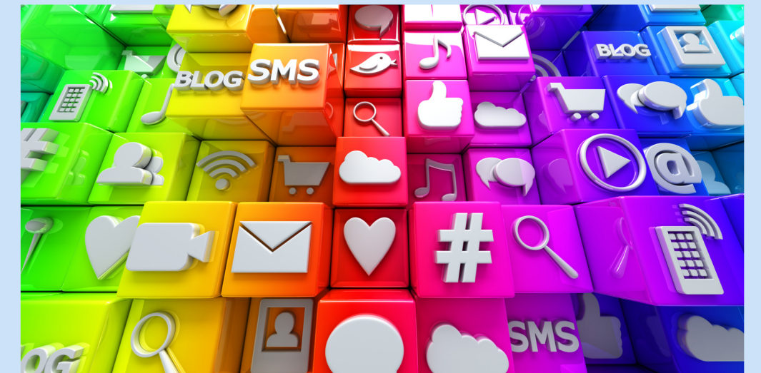
SNSマーケティング 取組先